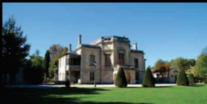
Château de Castel d'Andente