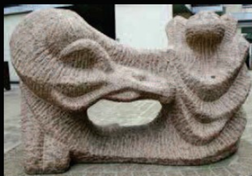
Statue de Shelomo Selinger