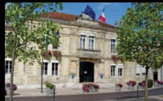
Mairie du Bouscat